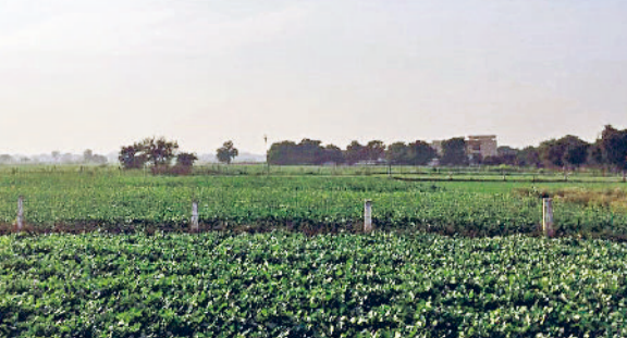
रेवाड़ी। रेवाड़ी-महेन्द्रगढ़ रोड स्थित एक खेत में सरसों की फसल।

छाने के बाद ही बढ़ना शुरू हो गया। शाम तक आसमान में आंशिक बादल छापे रहे। मौसम विभाग के अनुसार सप्ताह की शुरुआत साफ मौसम से हो सकती है, लेकिन तापमान में गिरावट आ सकती है। इस सप्ताह कड़ाके की ठंड शुरू हो सकती है। सप्ताह के अंत में आसमान में बादलों के बीच बूंदबांदी हो सकती है। सप्ताह के अंत में कोहरे का प्रकोप भी देखने को मिल सकता है।