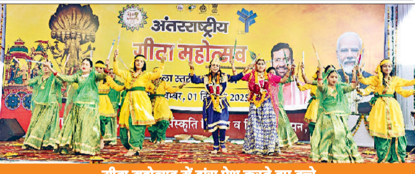
गीता महोत्सव में डांस पेश करते हुए बच्चे