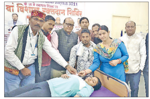
नारनौल। शिविर में रक्तदाता को बैज लगाते हुए।