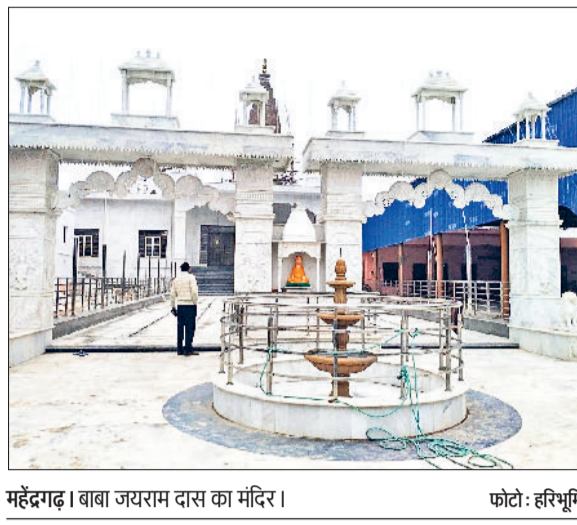
महेंद्रगढ़। बाबा जयराम दास का मंदिर।

14 जनवरी को होगा बाबा का मेला गांव पाली स्थित बाबा जयराम दास का महान मेला 14 जनवरी को आयोजित किया जाएगा। परमहंस बाबा जयरामदास महाराज का मेला 77वीं बार बाबा जयरामदास मंदिर कमेटी की देखरेख में किया जाएगा। इस दौरान मेले के उपलक्ष्य में खेलकूद प्रतियोगिता भी आयोजित की जाएगी। मेले में क्रिकेट, वॉलीबॉल, कबड्डी, नेशनल लडके और लडकियों आयोजित की जाएगी। इसके अलावा गोला फैंक, लंबी कूद व दौड़ प्रतियोगिता भी होगी। लडकियों की कबड्डी 13 जनवरी को प्रातः 10 बजे शुरू होगी। क्रिकेट प्रतियोगिता 31 दिसम्बर से प्रारंभ कर दी जाएगी। इसके अतिरिक्त कबड्डी लडकियों की 13 व 14 दिसम्बर को, वॉलीबॉल 14 जनवरी से, कुश्ती प्रतियोगिता 14 जनवरी को आयोजित की जाएगी। इसके अलावा दौड़ 100, 200, 400, 800, 1600, 3000, 5000, लडकियों की दौड़ 100 से 3000 मीटर तक की होगी एवं बच्चों व बुजुर्गों की भी दौड़ होगी, लम्बी कूद, 12 जनवरी प्रातः नौ बजे बाबा जयरामदास स्टेडियम पाली में करवाई जाएगी। प्रतियोगिता में विजेता खिलाड़ी को आर्कषक इनाम दिया जाएगा।