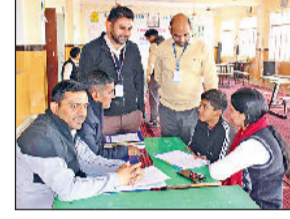
महेंद्रगढ़। बैठक में उपस्थित अभिभावक।