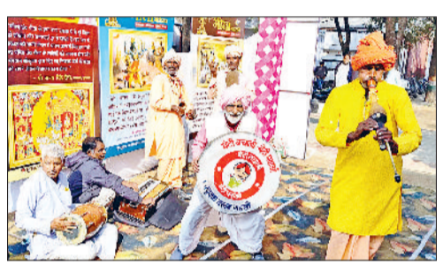
नारनौल। गीता महोत्सव के दौरान बिन की सुंदर सुर लहरियों पर नाचते आंगतुक, सांस्कृतिक कार्यक्रम प्रस्तुत करते विद्यार्थी व विजेता विधार्थी।