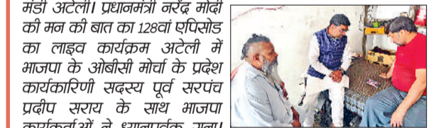
नारनौल। मन की बात कार्यक्रम देखते भाजपा कार्यकर्ता।

उन्होंने कहा कि प्रधानमंत्री मोदी के मन की बात कार्यक्रम के 128वें संस्करण में अयोध्या में राम मंदिर पर