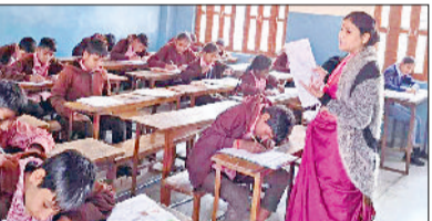
नारनौल। परीक्षा में भाग लेते बच्चे।

हरिभूमि न्यूज नारनौल राजकीय स्कूलों में पढ़ने वाले विद्यार्थियों को प्रोत्साहन के लिए राज्य शैक्षिक अनुसंधान एवं प्रशिक्षण परिषद् गुरुग्राम की ओर से राष्ट्रीय साधन सह योग्यता छात्रवृत्ति योजना (एनएमएमएसएस) की परीक्षा शांतिपूर्ण माहौल में नकल रहित संपन्न हुई। जिला महेंद्रगढ़ के लिए 1914