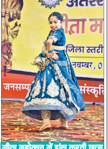
गीता महोत्सव में डांस करती छात्रा

है और जो व्यक्ति इसका अनुसरण करता है, वह सर्वश्रेष्ठ बन जाता है। उन्होंने कहा कि मनुष्य को यदि अपने जीवन में बदलाव और तत्काली लाना है तो गीता में निहित श्लोकों का अनुसरण करना होगा।